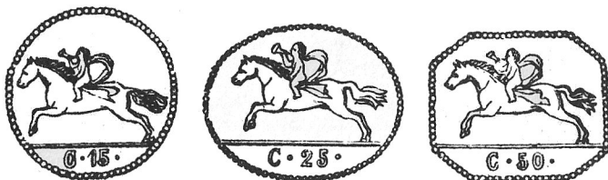
El "Cavallini" sardo, primer entero postal, emitido en 1818.

Este tipo de valor postal es aún más antiguo que el sello de correos, pues ya desde 1818 se utilizó en Cerdeña (antiguo estado de Italia) una hoja de papel que llevaba impreso en tinta azul la representación del franqueo con un correo a caballo, realizándose posteriormente mediante la impresión a relieve en seco. Estos enteros postales son conocidos con el nombre de "Cavallini" por representar como decimos anteriormente, un hombre a caballo y aunque no tuvieron en su origen un carácter oficial, fueron las primeras piezas postales con el franqueo previo impreso en ellas.