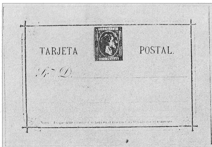
El primer entero postal de Cuba, que celebra su centenario, emitido en 1878.

Cuba, que emitió su primer entero postal en 1878, es decir, hace cien años exactamente, ha realizado distintas emisiones de enteros postales, pero siempre limitándose, tanto en las tarjetas postales, sobres y fajas de periódicos, a imprimir el sello o signo de franqueo solamente y sin mostrar otra variante, pero desde 1961 el Gobierno Revolucionario ha comenzado a emitir una serie de tarjetas y sobres franqueados que tienen distintas vistas o fotografías en las que se reflejan el desarrollo de la Revolución, las bellezas naturales de nuestro país, flores y otros diseños.